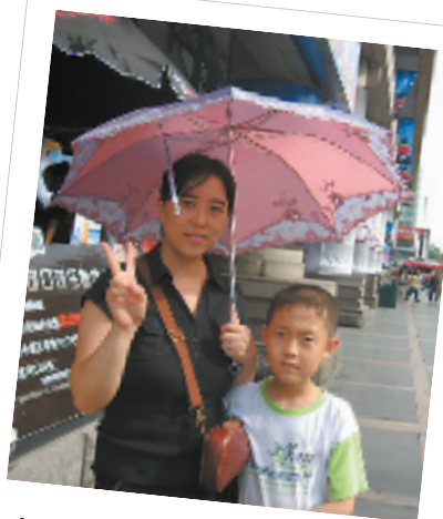
小叮当母子, 小叮当9岁

装备么，早就想好啦，衣服一定要穿亮色的，发现在青岛穿亮色的会心情好，天蓝蓝海蓝蓝，穿暗色的太不应景了。还会准备奥运加油T恤哦，这个是必须的。