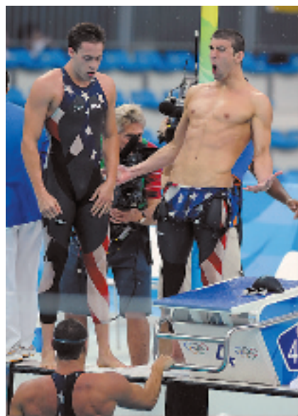
美国队的星条旗鲨鱼皮