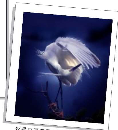
这是老潘自己最满意的一幅作品。