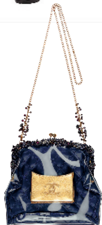
紫蓝色漆皮缀珠花斜背袋约 36000 元