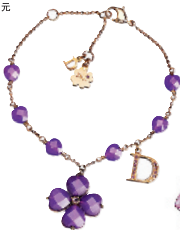
紫色晶石花形吊坠手链约 2000 元