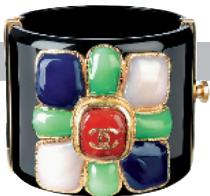
黑色缀晶石粗手镯约 9500 元