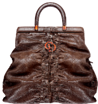
咖啡色牛皮手挽袋约 17000 元