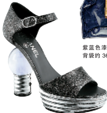
灰黑色闪粉灯泡鞋跟高跟鞋约 15000 元