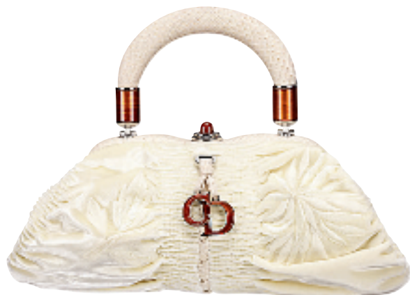
米白色丝绒手挽袋约 13000 元