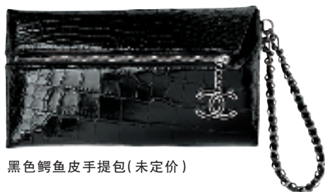
黑色鳄鱼皮手提包(未定价)