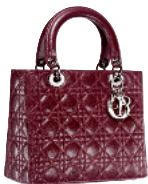
枣红色漆皮小手挽袋约 5500 元