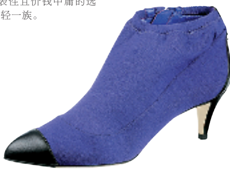
紫色棉质拼皮革靴约 8000 元