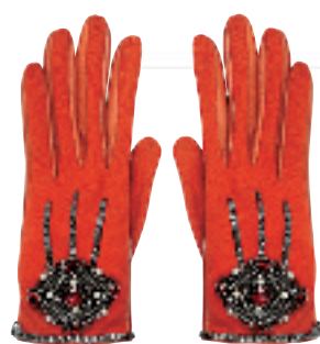
红色棉质拼皮革钉珠手套约 12000 元