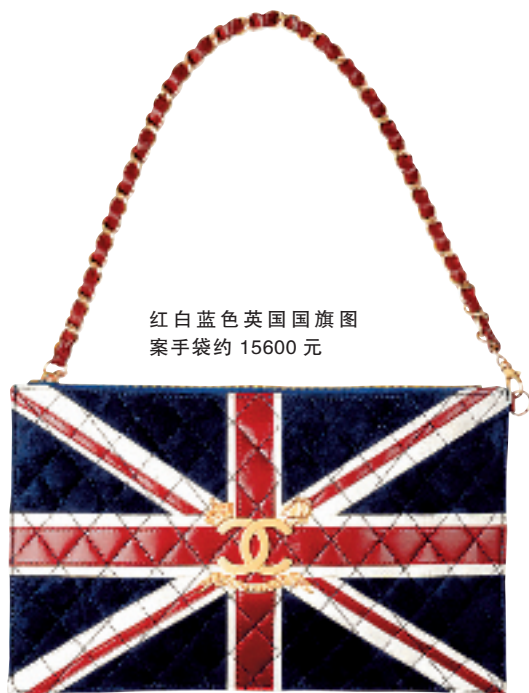
红白蓝色英国国旗图案手袋约 15600 元

Chanel 向来是时装界的焦点,每一件刻上双 C logo 的产品,都势必成为 fans 的心头好。Tweed coat 和 2.55 手袋以外, costume-jewelry 和 two-tones 鞋子,其实都是很具有代表性且价钱中庸的选择,最适合年轻一族。