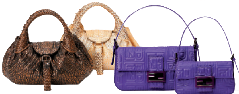
深啡色裂纹皮革侧背袋约 20000 元