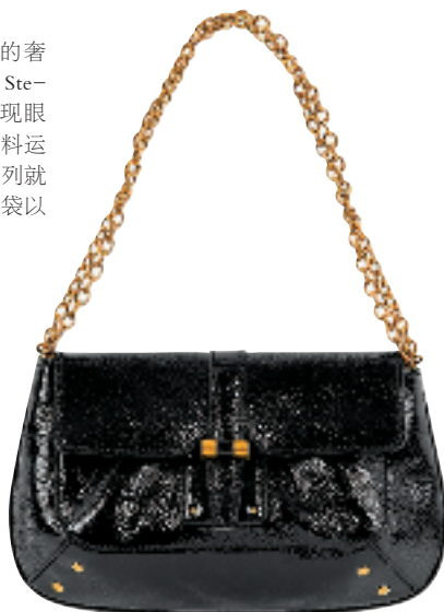
黑色令面皮革金链手袋约 8000 元