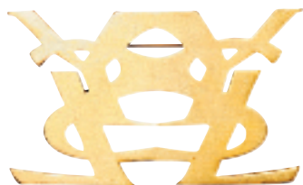
金色双 logo 扣针约 1800 元

度过了 Tom Ford 给予圣罗兰的奢华盛世,2004 年上任为设计总监的 Stefano Pilati, 将品牌的中性美再度重现眼前,再渗入个人拿手的建筑美学与布料运用,令品牌踏向另一高峰。08 初秋系列就如带大家进入圣罗兰的怀旧世界,手袋以漆皮和中性灰调为主,简单有型。