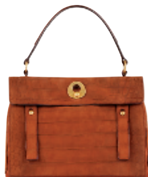
橙红色鳄鱼纹中号侧背袋约 15000 元