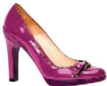
紫色漆皮缀皮带扣高跟鞋约 5000 元