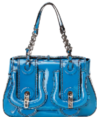
蓝色漆皮 B. Fendi 双扣侧背袋约 13000 元