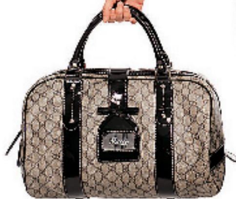
黑 / 金色高跟鞋约 5,400 元 咖啡色长方形手挽袋 未定价

在众多品牌中, Gucci 的初秋系列可算最齐备,高雅的手袋和鞋子的选择较多,而配上金色 Hysteric 标记和蛇皮用料系列,更是突显身分的款式,比传统的 GG 花样更有新意。