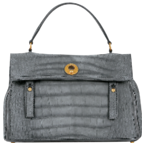
灰色麂皮鳄鱼纹侧背袋约 15000 元