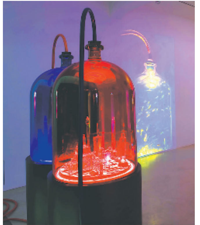
▼著名美国艺术家 Mike Kelley 的《浮游生态》