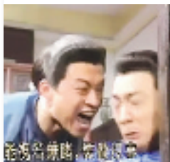
用河马嘴征服你的咆哮教