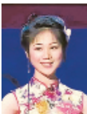
风华绝代的陀螺教