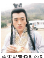
宇宙影帝级别的鞋拔教