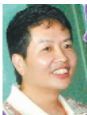
嘴大无品的祖德教