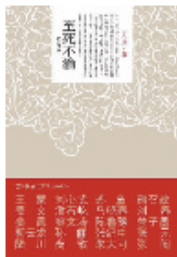
《至死不渝》 艾米 著 群言出版社 定价：32 元

“史上最干净的爱情小说”《山楂树之恋》作者艾米的新小说。完全颠覆了艾米在成名作《山楂树之恋》中所确立的纯情路线，其内容和思想更具现实意义。故事讲述了军工厂工人家庭出生的石燕，在那个“备战、备荒、为人民”的年代，其命运的迅速转变和人生抉择，也描绘了一个懵懂的少女如何面对爱情、现实以及婚姻，达到母性觉醒，逐步走向成熟的心理过程。作者对这部作品的自我评价为：“这是成熟之后的单纯，喧嚣之后的平静，绚烂之后的简洁。”