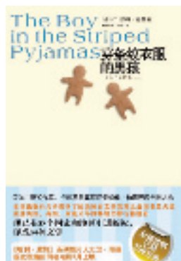
《穿条纹衣服的男孩》 (爱尔兰) 伯恩著 龙婧译 陕西师范大学出版社 定价：25 元

这是一个孩子的故事。一个 9 岁小男孩布鲁诺在奥斯维辛所经历的“探险”，一个纳粹男孩与犹太男孩间纯真的友谊。