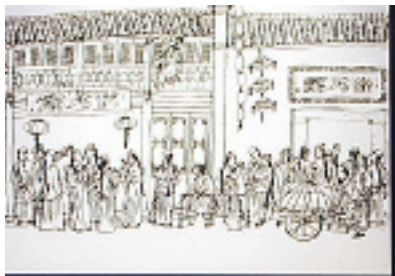
状元馆、奎元馆吃面