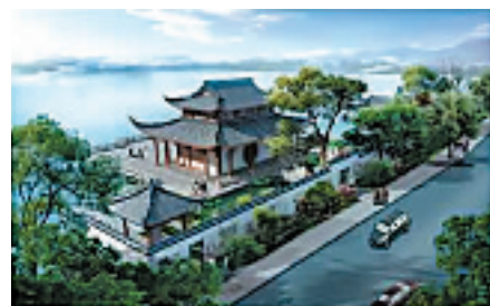
新规划的平湖秋月,水岸边与人行道有6米宽,在绿化带中间设墙,恢复水院(效果图)