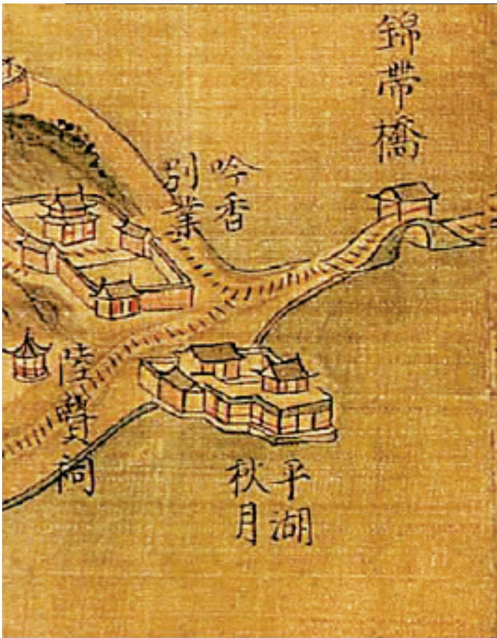
乾隆年间行宫图中的平湖秋月