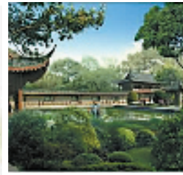
新规划的花港观鱼,西侧、北侧恢复长廊(效果图)