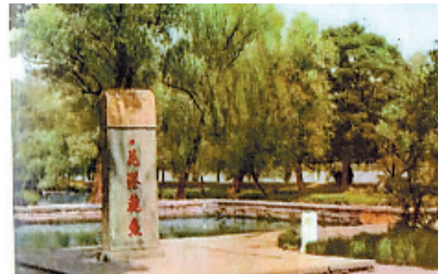
民国的花港观鱼,只剩下石碑