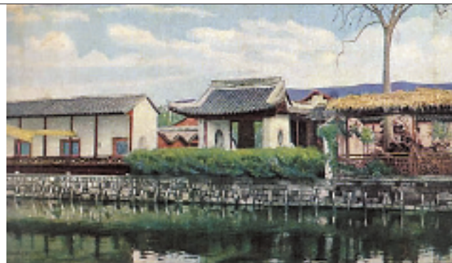
清末的花港观鱼,也是庭院结构