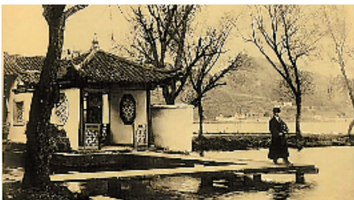
民国时的平湖秋月,其楼阁依然在