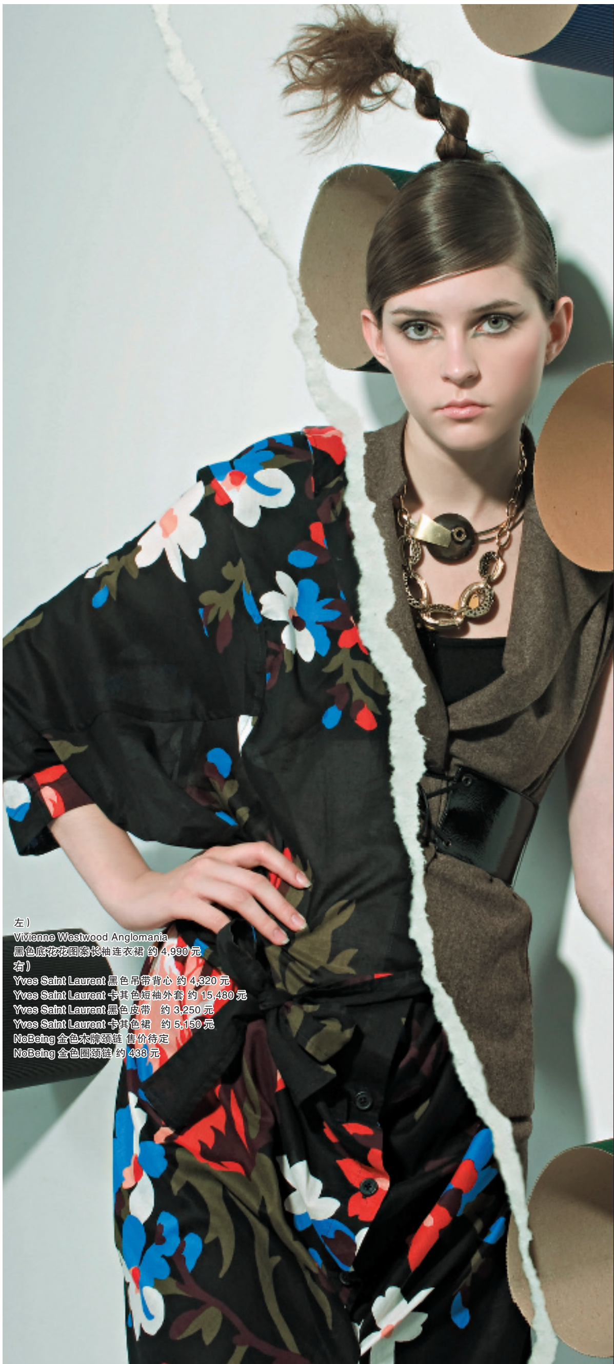
左) Vivienne Westwood Anglomania 黑色底花花图案长袖连衣裙 约 4,990 元 右) Yves Saint Laurent 黑色吊带背心 约 4,320 元 Yves Saint Laurent 卡其色短袖外套 约 15,480 元 Yves Saint Laurent 黑色皮带 约 3,250 元 Yves Saint Laurent 卡其色裙 约 5,150 元 NoBeing 金色木牌项链 售价待定 NoBeing 金色圆项链 约 438 元