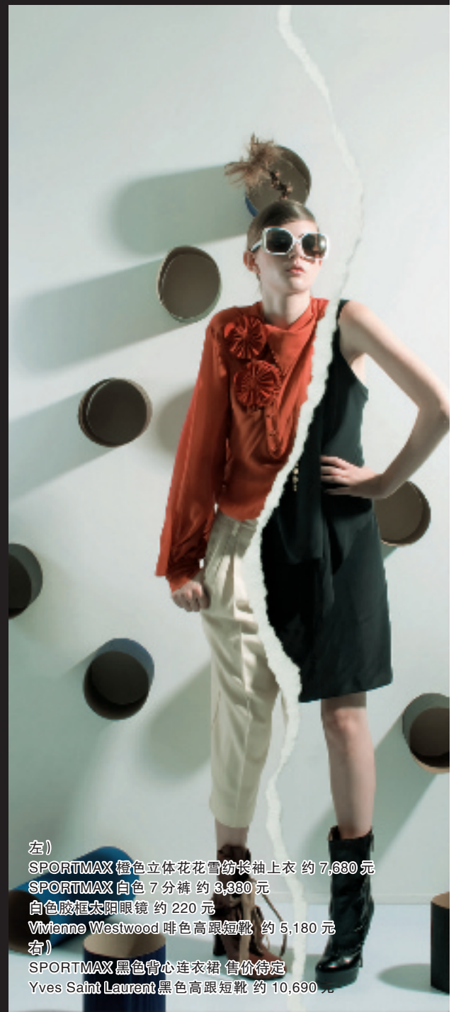
左) SPORTMAX 橙色立体花花雪纺长袖上衣 约 7,680 元 SPORTMAX 白色 7 分裤 约 3,330 元 白色胶框太阳眼镜 约 220 元 Vivienne Westwood 啡色高跟短靴 约 5,180 元 右) SPORTMAX 黑色背心连衣裙 售价待定 Yves Saint Laurent 黑色高跟短靴 约 10,690 元