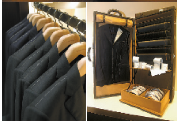
▲杭州大厦外特别搭建的杰尼亚展示区中,摆放着剪刀、量尺、面料、皮革等,最后是成衣。