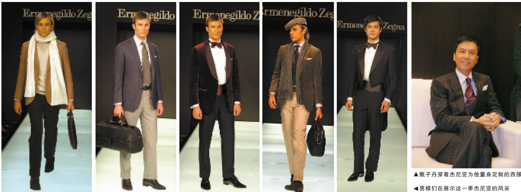
▲甄子丹穿着杰尼亚为他量身定制的西服