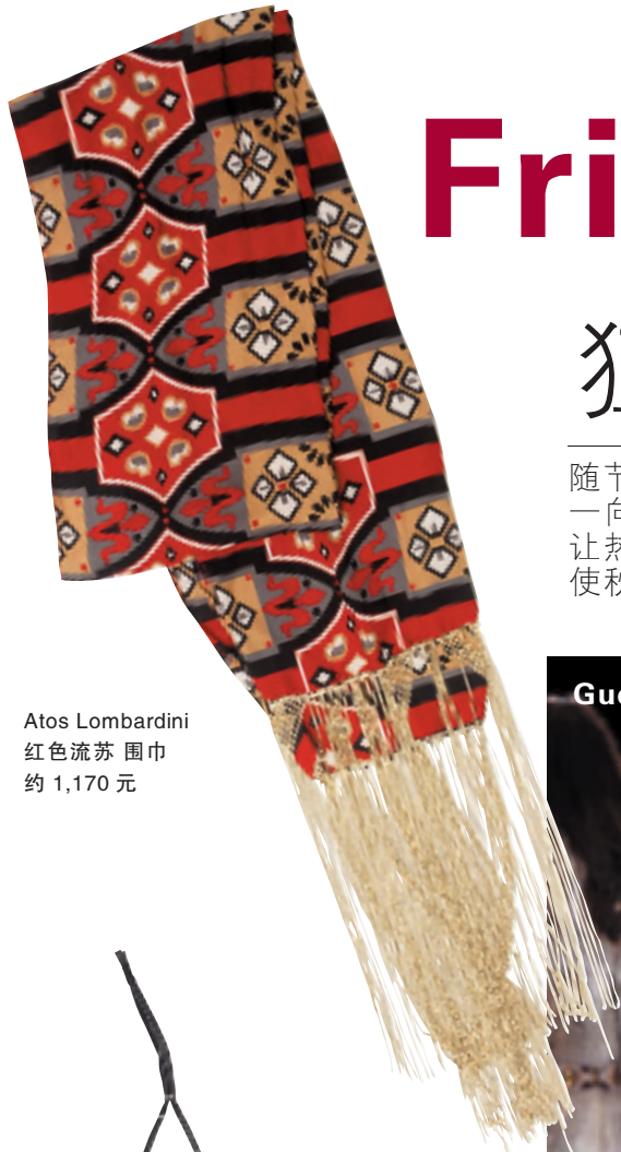
Atos Lombardini 红色流苏 围巾 约 1,170 元

随节拍摆动的流苏于今年秋冬随处可见。流苏一向都予人热带风情感觉,经设计师点石成金,让热情感觉恰当地融入冷漠的秋冬,一冰一火,使秋冬都充满朝气。