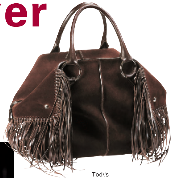
Tod's 啡色反摺流苏手袋 约 12,700 元