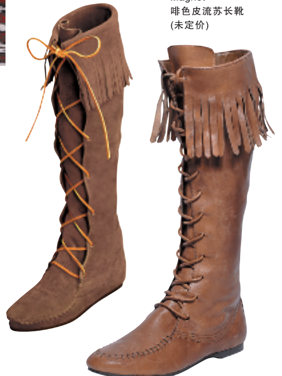
Magnet 啡色皮流苏长靴 (未定价)