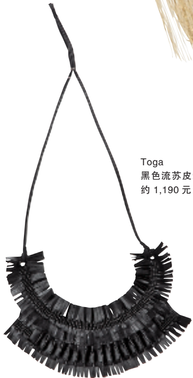
Toga 黑色流苏皮颈链 约 1,190 元