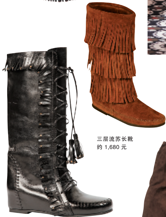
Miss Sixty Kira 黑色流苏长靴 约 2,390 元