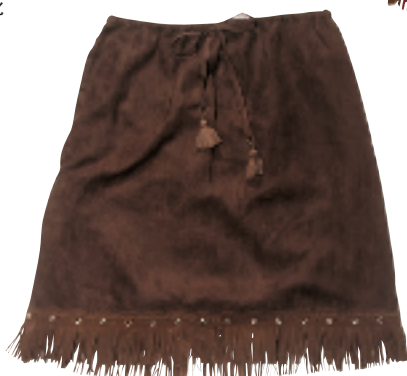
Ehyphenworld Gallery 咖啡色麂皮半截裙 约 699 元