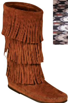
三层流苏长靴 约 1,680 元