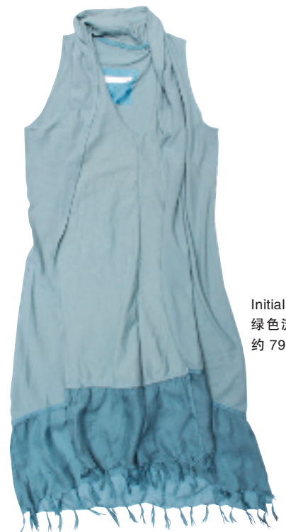
Initial 绿色流苏连身裙 约 790 元