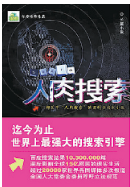
《人肉搜索》 孙浩元 著 重庆出版社 定价:29.8元

“人肉搜索”的强大和来势汹汹,我们算是体会了很多次了。卖身救母事件、虐猫事件、史上最毒后妈事件、艳照门事件、姜岩事件、很黄很暴力事件……这个被洛杉矶时报称为“让国际刑警黯然失色”的人肉搜索一出现,这原本虚幻的互联网也藏不了秘密了。以前都说,谁也不知道屏幕后是不是一条狗,有了“人肉”,就算屏幕后是一条狗,也能把这狗的品种、年龄、外形、体重甚至它的三大姑八大姨都一一找出。最近,第一本探讨人肉搜索现象的悬疑小说的出版,引起了各方关注。