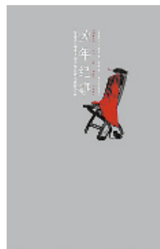
《凶年纪事》 库切 著 浙江文艺出版社 定价:32元

七堇年在序言里表示:这本小说是我以书写诘告般的心情着笔,为人心的希望和幻灭,为人间的纯洁和污秽,书写散发着腐臭的供词。