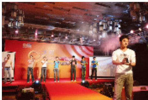
中国电信现场手机秀

自 5 月份中国电信斥巨资收购中国联通 133、153 网络之后,马上就开始实施全面的网络升级改造。改造的目标有三个:一是确保网络质量达到国内先进水平;二是把以语音为主的移动业务改造为以互联网为主的移动业务;三是从第二代网络升级为第三代网络。中国电信计划在明年 3 月份在全国范围内完成这项改造工程。经过改造以后的网络和业务将会给新老客户耳目一新的感觉。这个成果,不仅适用于 189 网络号段的用户,也同样惠及 133、153 网络号段的用户。具体什么时候开放 3G 业务,将取决于国家牌照的发放。