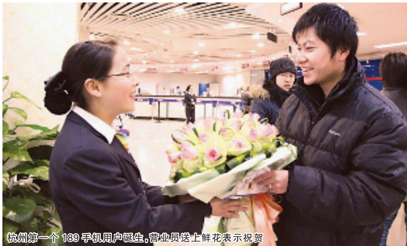
杭州第一个 189 手机用户诞生,营业员送上鲜花表示祝贺