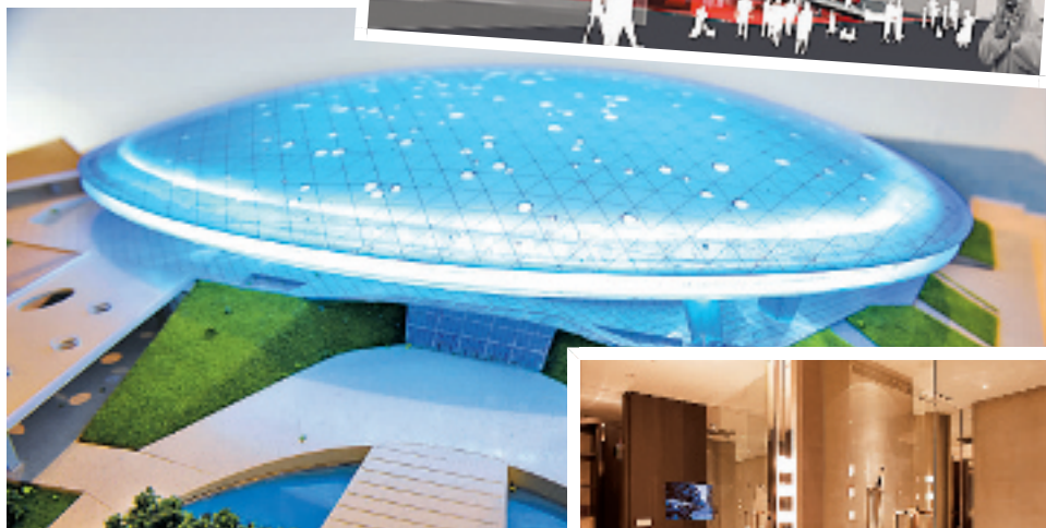
貌似 UFO 的演艺中心