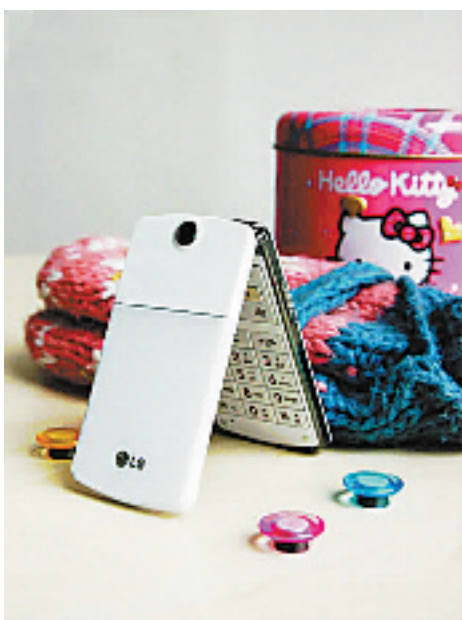
LG 冰激凌 KF350

“美国的台式电脑都称斤卖了！”在美国工作的 JIMY 最近向我透露。不光是电脑，受金融风暴的影响，手机也成了降价的焦点，就连一向不动价格的苹果手机也开始降价，16GB 版 iPhone 3G 最近大跌 400 元。在高端手机降价的同时，低端手机悄悄成了目前销售的热点，许多大牌手机为此发布了众多针对低端市场的廉价手机，有些已经接近山寨机的价格。这些低端手机大多功能简单，但质量过关。以往这些手机在面市之后马上被智能、音乐手机代替，而今却重回市场，成为一大销售热点。