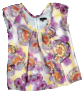
Mulberry 粉红 / 紫色大花图案丝质上衣 (未定价)