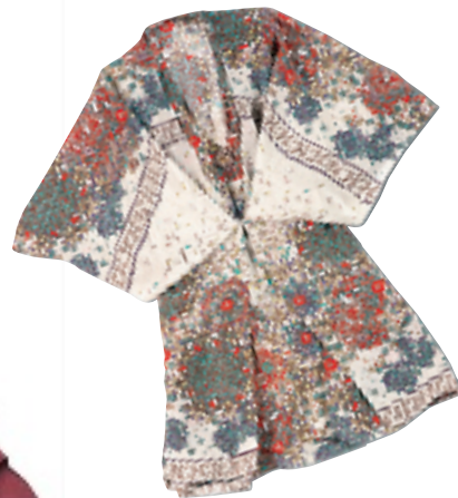
Anna Rita N 红 / 绿色碎花和式大袖上衣(未定价)