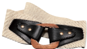
Sinequanone 米色缀木扣粗腰带(未定价)

东方文化的博大精深,传统的民族花多年来都成为时装主题。今年春夏,更富东方色彩如日本和式设计、中国式碎花和带点原始风味的啡黄色系,也将于时装界大放异彩,为固有的黑白型格舞台带来更广阔的视野。