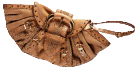
Dior 啡色缀金属钉百褶手袋(未定价)