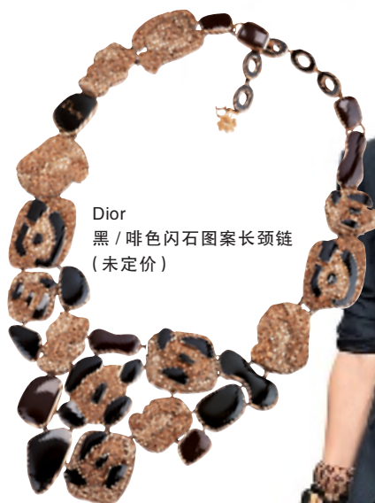
Dior 黑 / 啡色闪石图案长颈链 (未定价)