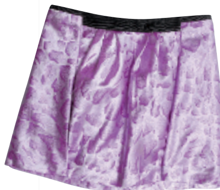
mani Exchange 紫色水印色丁料半截裙(未定价)