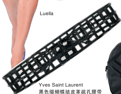
Yves Saint Laurent 黑色缀蝴蝶结皮革穿孔腰带 约 3,250 元