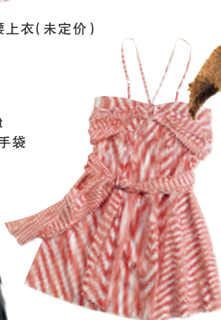
Replay 红白色间纹棉质缀蝴蝶结吊带裙 (未定价)