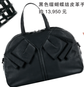
Yves Saint Laurent 黑色缀蝴蝶结皮革手袋 约 13,950 元