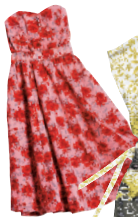
H&M 鲜红色花卉图案棉质连身长裙 约 249 元

花卉图案能成为长青潮流,只因爱女性娇柔味的支持者实在多不胜数。春夏的碎花图案,纷纷配上柔和的色调与用料,把花卉图案带来的年轻飘逸推上更高层次,即使如 Luella 般用上硬朗的剪裁和颜色,也能把碎花的女性美表露无遗。