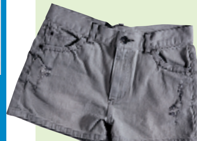
Jeanasis 灰色牛仔短裤 约 609 元