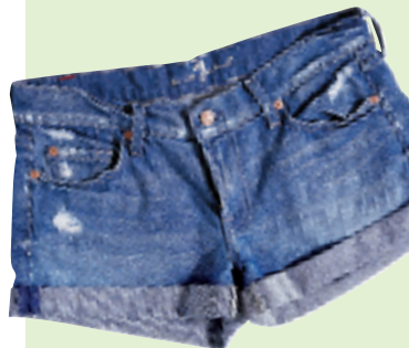
7 for all mankind 蓝色牛仔短裤 约 1,580 元