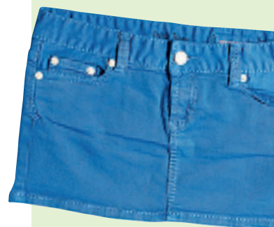
Salad 彩蓝色牛仔迷你裙 约 475 元

以平日上班的衬衫恤衫,下衬牛仔短裤,定能给人耳目一新的感觉。以长T恤搭配牛仔短裤,一长一短的混搭,可增加造型的层次感。