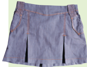
ANNARITA N 紫蓝色打褶牛仔迷你裙 约 2,150 元