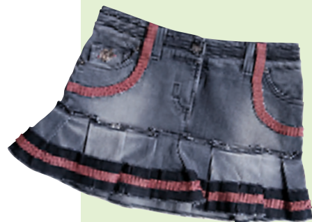
galliano 深灰粉红色褶皱牛仔迷你裙 约 3,450 元