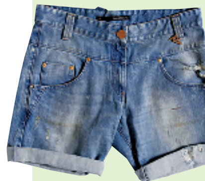
ANNARITA N 蓝色牛仔短裤 约 2,150 元