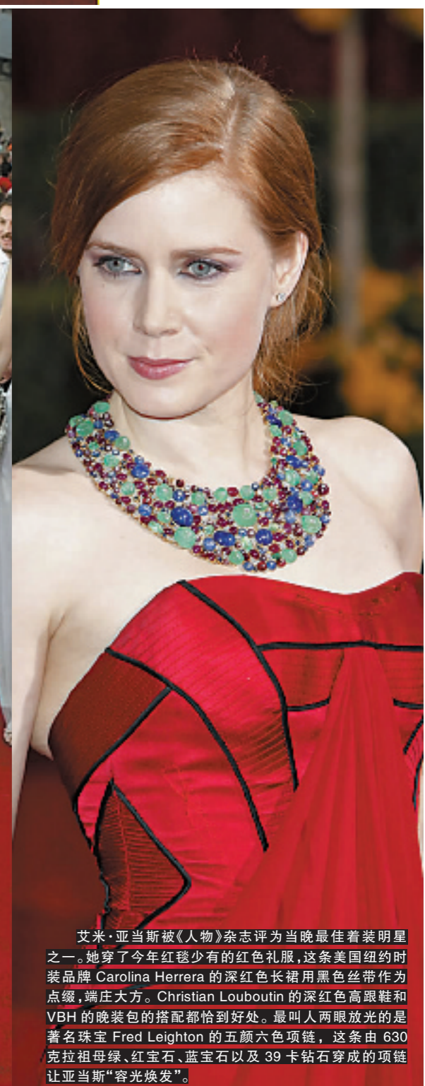
艾米·亚当斯被《人物》杂志评为当晚最佳着装明星之一。她穿了今年红毯少有的红色礼服，这条美国纽约时装品牌 Carolina Herrera 的深红色长裙用黑色丝带作为点缀，端庄大方。Christian Louboutin 的深红色高跟鞋和 VBH 的晚装包的搭配都恰到好处。最叫人两眼放光的是著名珠宝 Fred Leighton 的五颜六色项链，这条由 630 克拉祖母绿、红宝石、蓝宝石以及 39 颗钻石穿成的项链让亚当斯“容光焕发”。