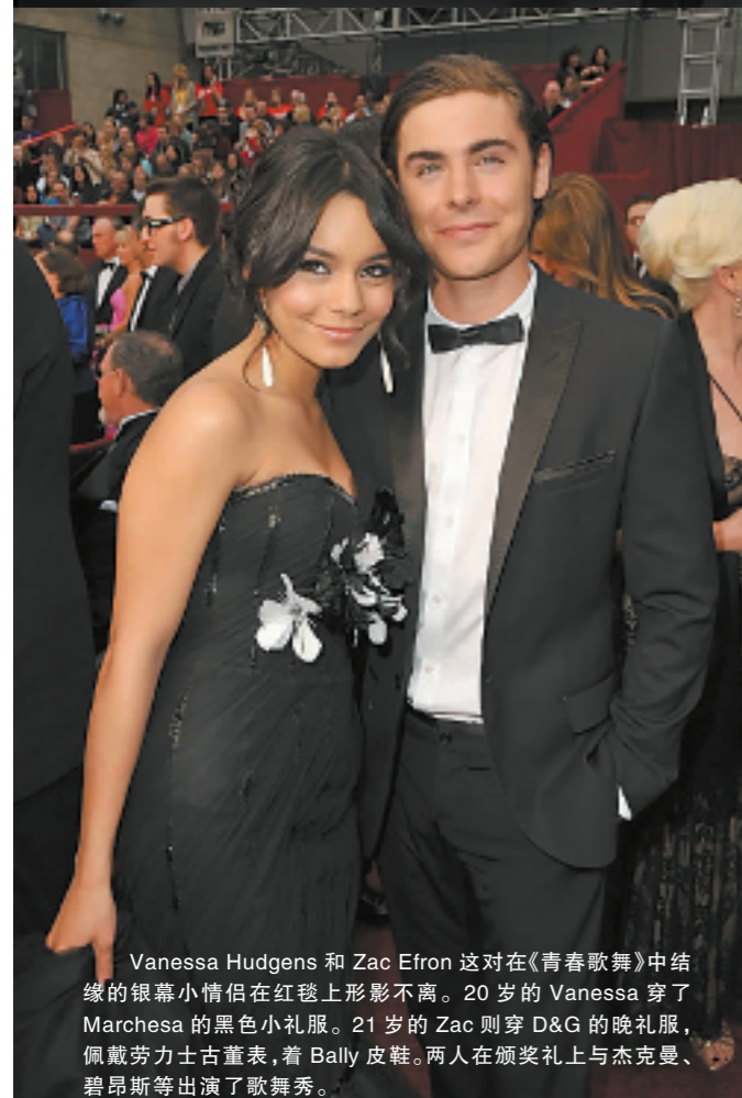
Vanessa Hudgens 和 Zac Efron 这对在《青春歌舞》中结缘的银幕小情侣在红毯上形影不离。20 岁的 Vanessa 穿了 Marchesa 的黑色小礼服。21 岁的 Zac 则穿 D&G 的晚礼服，佩戴劳力士古董表，着 Bally 皮鞋。两人在颁奖礼上与杰克曼、碧昂斯等出演了歌舞秀。