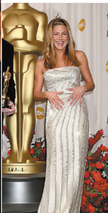
珍妮佛·安妮斯顿当晚和杰克·布莱克颁发最佳动画奖。安妮斯顿的着装永远不会出错，但也少了惊艳。银色的 Valentito 礼服、Jimmy Choo 缎子凉鞋和 Fred Leighton 的珠宝。