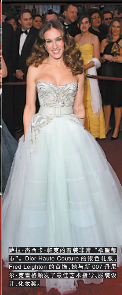
萨拉·杰西卡·帕克的着装非常“欲望都市”。Dior Haute Couture 的银色礼服，Fred Leighton 的首饰，她与新 007 丹尼尔·克雷格颁发了最佳艺术指导、服装设计、化妆奖。