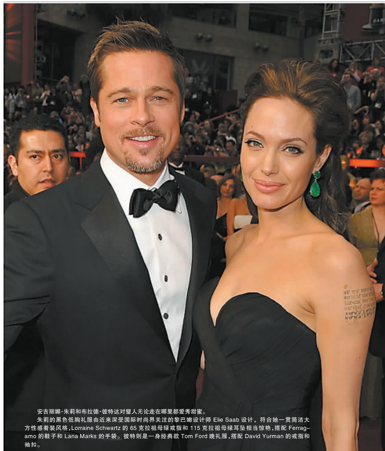
安吉丽娜·朱莉和布拉德·彼特这对璧人无论走到哪里都爱秀甜蜜。朱莉的黑色低胸礼服由近来深受国际时尚界关注的黎巴嫩设计师 Elie Saab 设计，符合她一贯简洁大方性感着装风格，Lorraine Schwartz 的 65 克拉祖母绿戒指和 115 克拉祖母绿耳坠相当惊艳，搭配 Ferragamo 的鞋子和 Lana Marks 的手袋。彼特则是一身经典 Tom Ford 晚礼服，搭配 David Yurman 的戒指和袖扣。