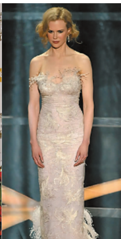
妮可·基德曼作为颁奖礼的神秘嘉宾没有走红毯。她当晚穿一袭 L'Wren Scott 的白色鱼尾长裙。作为前辈的妮可在颁发最佳女主角奖项时大赞安吉丽娜·朱莉在《换子疑云》中的表演。