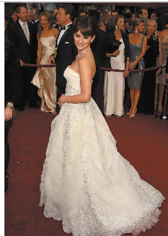
最佳女配角佩内洛普·克鲁兹一直深得时尚圈宠爱，这次她穿的是 Pierre Balmain 的高级定制复古礼服。这款礼服源自 40 年代的经典款式，裙子上印有 Balmain 经典花纹，而且也是这款礼服裙近年首次被重新翻新制造。王菲曾在 2000 年台北演唱会上穿过同款的裙子，所不同的是王菲版的是 40 年代的原版古董裙，原本白色的纱略微发黄。比较可惜的是克鲁兹最近身材臃肿走样，虽然佩戴价值 300 万的钻石项链，还是觉得和《午夜巴塞罗那》的神经质美貌女画家相去甚远。