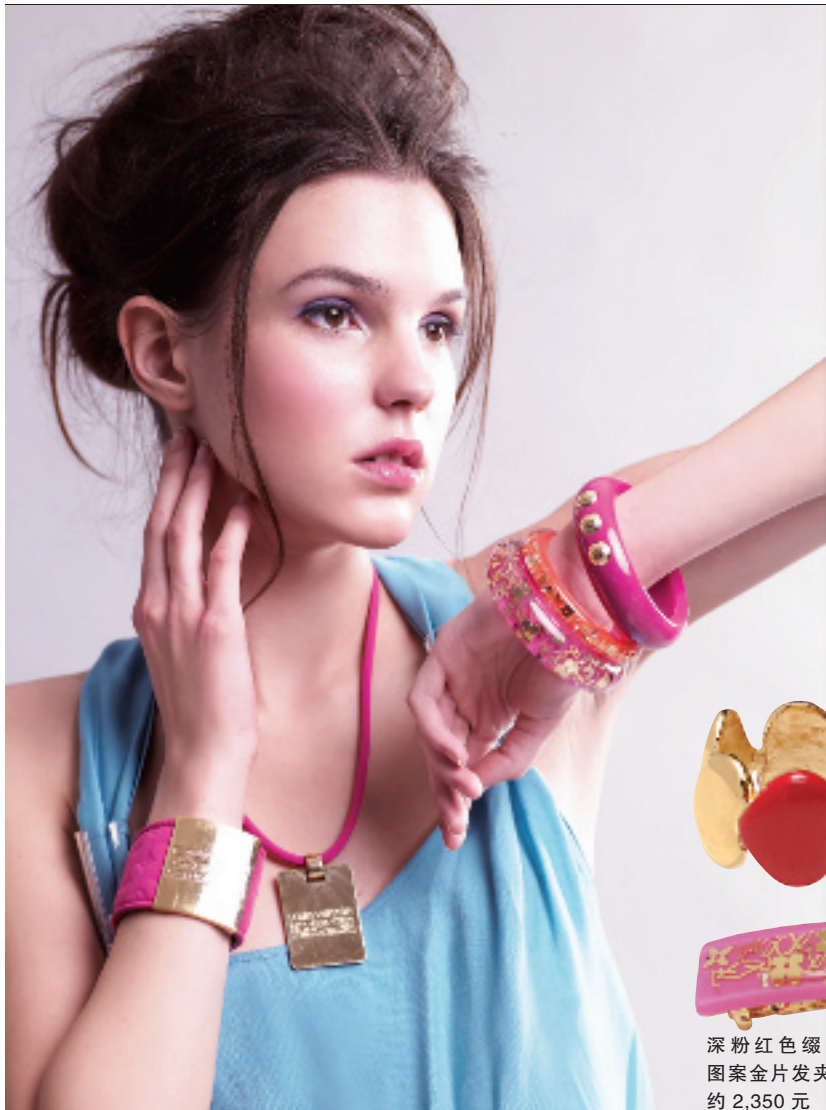
鲜粉红色缀金属牌颈链 约 3,900 元 鲜粉红色缀金属牌粗手带 约 6,500 元 鲜粉红色缀印花 LOGO 金属粗手镯 约 3,400 元 鲜橙色缀印花 LOGO 金属手镯 约 2,450 元 鲜粉红色缀金属粒粗手镯 约 2,450 元

这个春夏绝对是亮色的天下,上至服饰下至鞋子饰物,都纷纷添上无限的色彩。一向懂得攻陷年轻 OL 芳心的 Louis Vuitton,在初春饰物系列中也大玩抢眼至极,接近萤光的红和橙色,令传统的 LV 印花图案设计感觉更活泼年轻,有谁能抵挡这样的诱惑?