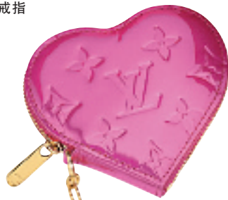
深粉红色漆皮印花 LOGO 压花心形零钱包 约 3,650 元