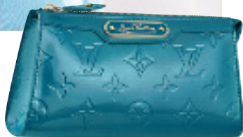
湖水蓝色漆皮印花 LOGO 压花化妆袋 (未定价)