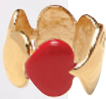
金 / 红色心形图案金属戒指 约 2,150 元