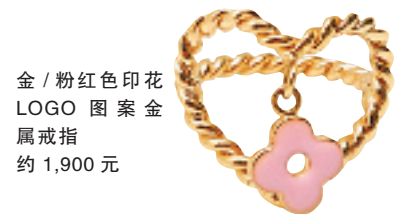
金 / 粉红色印花 LOGO 图案金属戒指 约 1,900 元