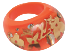
橙色缀印花 LOGO 图案金片戒指 约 1,900 元