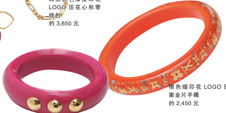
橙色缀印花 LOGO 图案金片手镯 约 2,450 元