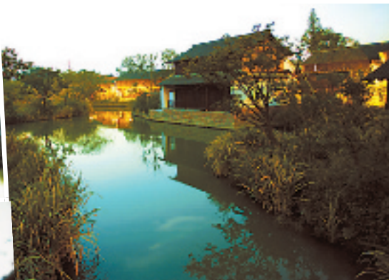
夜幕下的高庄农家小屋