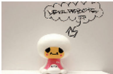
Devil Robots, Toby 最喜欢的玩具之一