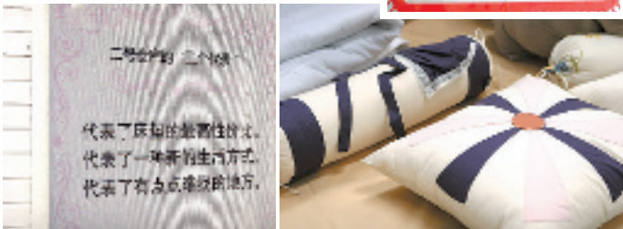
标语式广告是二号仓库的特色