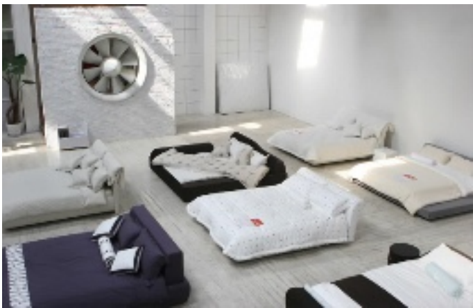
二号仓库里摆着上百张样品床