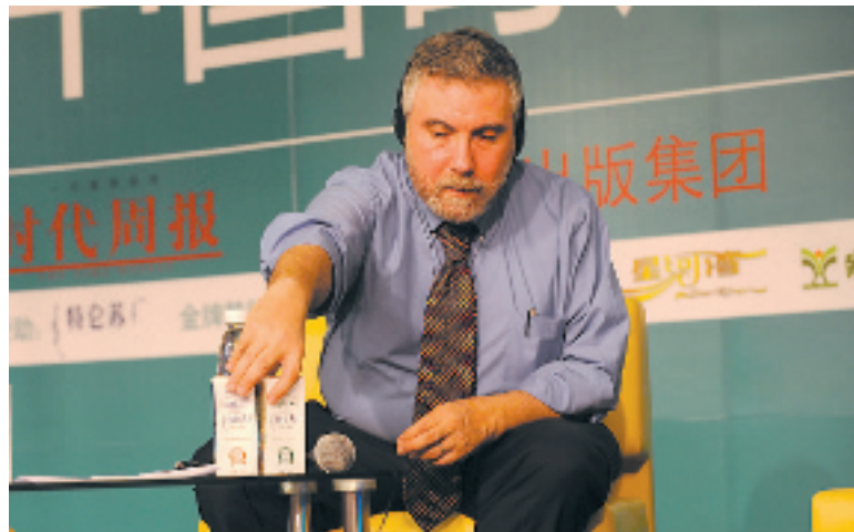
诺贝尔经济学奖得主克鲁格曼对特仑苏表现出了极大的兴趣