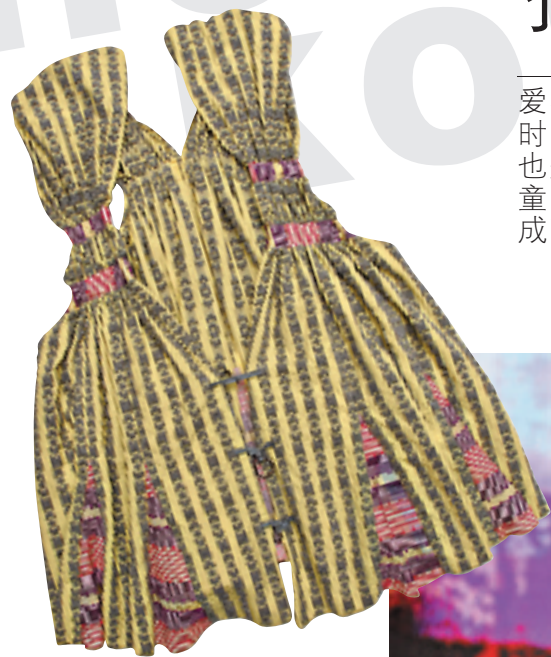
Frapbois 淡黄色织花背心 约 3,699 元

爱美是女生的天性，谁都渴望能留住青春的时光，除了保养肤质、保持青春的心境，打扮也是不二法门。时尚界流行 child woman (孩童般的女人)一词，柔和少女造型，同时不失成熟妩媚，叫人难以抗拒。