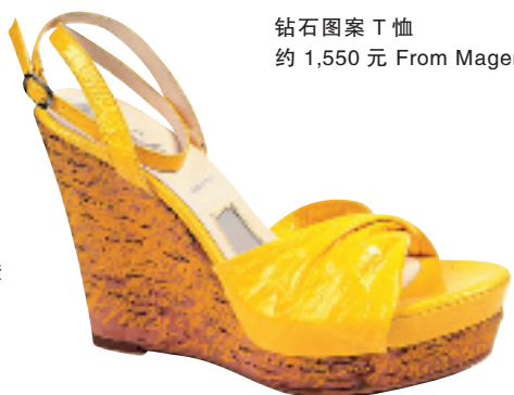
Miss Sixty 鲜黄色漆皮凉鞋 约 1,790 元