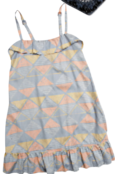
Insight 粉色三角图案吊带裙 约 600 元 From Seibu