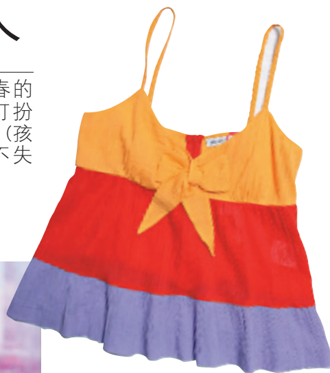
See by Chloe 三色吊带背心 约 1,690 元