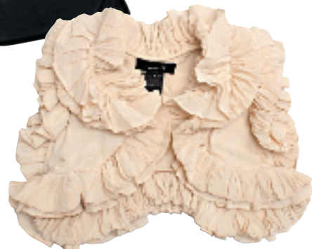
Isabel Marant 米色丝质褶皱背心 约 3,999 元