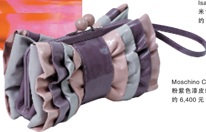
Moschino Cheap & Chic 粉紫色漆皮蝴蝶零钱包 约 6,400 元