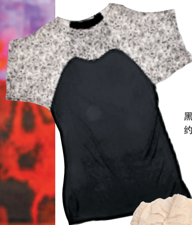
黑白色印花连衣裙 约 1,070 元 From Magenta