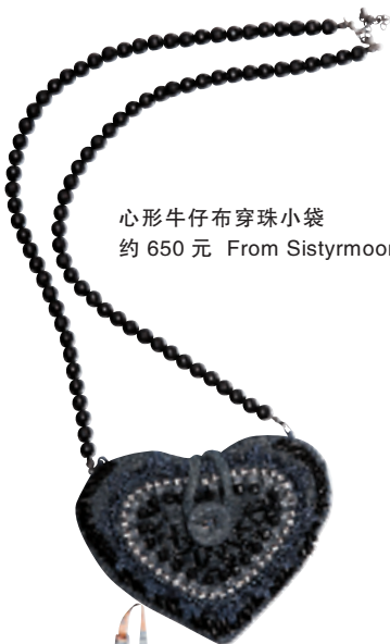
心形牛仔布穿珠小袋 约 650 元 From Sistrymoon