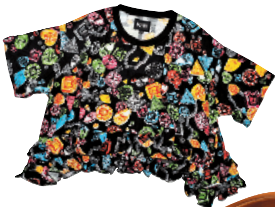
钻石图案 T 恤 约 1,550 元 From Magenta