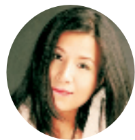
本报特邀新锐女作家深海水妖开设“妖刀无定式”专栏。

这几年婚姻成了最脆弱的东西。一夜之间,小三泛滥。而2008年,连续被媒体披露了好些件家庭悲剧,无一例外是丈夫背叛家庭,第三者介入,被伤害的妻子绝望后轻生。以至于许多女性将2008年称为小三年。