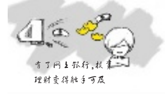
有了网上银行,投资理财变得触手可及

当理财成为一种时尚,选择一个好的渠道进行投资理财很重要。有了工行网银,你只需轻点鼠标就可以将股市资金转入银行存放通知存款或购买超短期理财产品,也能随时杀回股市,买黄金、炒外汇、期货交易、基金定投也变得十分容易,所购基金的净值也是一目了然。你在享受便捷服务同时还能了解最新投资理财资讯、学习最新投资理财方式。