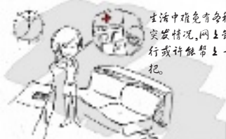
生活中难免有各种突发情况,网上银行或许能帮上一把。

深夜接到朋友急需电话,可银行早已关门,怎么汇给他?自己或家人手机突然欠费停机,可附近没有营业厅买充值卡?别着急,通过工行网上银行能马上搞定。网上银行提供全天候24小时不间断服务,就是为了解决你的不时之需。