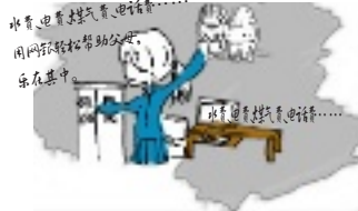
水电煤气费、电话费...用网银轻松帮助父母,乐在其中。

对于老人来说,最不便的就是跑银行。缴水费、电费,查看退休工资,存定期、买国债都得跑银行。如果有了工行网上银行,你可以把父母退休工资的账户进行托管,以后查看退休金、办理定期存款、买国债、缴水电煤气费这些事就帮父母都办齐了。让工行网银代你尽孝,够意思吧。