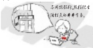
不用跑银行,照样把生活打理得井井有条。

虽然现在银行网点环境越来越好,但为了芝麻绿豆小事跑银行总有点麻烦。如果将银行委托代扣和网银配合使用,那么“跑银行”的日子就会远去。你可以设一个专门用于银行扣款的账户,将水电煤气房贷等各项费用统统用这个账户代扣,然后通过工行网上银行设定,每月从工资卡里划转一笔资金到扣款账户,安全又方便。此外,工行网银同样支持信息通讯费、报刊费、学杂费、考试报名费等多项费用缴纳,转账汇款更是不在话下。