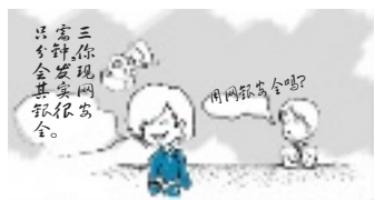
只需三分钟,你会发现其实网银很安全。

网上银行的不安全因素,主要是存在靠技术吃饭的黑客和靠嘴巴忽悠的骗子。对于前者,一是验证“预留验证信息”避免登陆假网站;二是采用更安全的加密手段,如果交易金额较小,可以采用“动态口令卡”;如果金额较大,可以选择U盾,这是一张用国际先进技术打造的盾牌,若还不放心,还可以用“手机短信验证”再把一道关。对于后者,就得提高警惕,一是少和陌生人进行网上交易,二是尽量选择知名网站购物,三是使用过程中不要开启操作系统、MSN和QQ等工具的远程协助功能。如果你对这种方法还不是很有把握,又想早点体验网上银行的惬意,只要暂时不开通网银的对外转账和电子商务功能,就能免去后顾之忧,还能照常使用网银的其他功能。