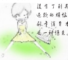
没有了到期还款的烦恼,刷卡消费才是一种惬意。

作为现代白领,没有一两张可透支消费的信用卡,总显得有那么一点out。但在潇洒刷卡的背后,却是按时还款的麻烦。心里老惦记着还款日期,一不小心就容易产生透支利息。如果你有一张工行的灵通卡,并办理了工行的网上银行,便可将其与信用卡绑定。还款日期一到,工行网上银行系统便会自动替你还款,解除刷卡消费的后顾之忧。